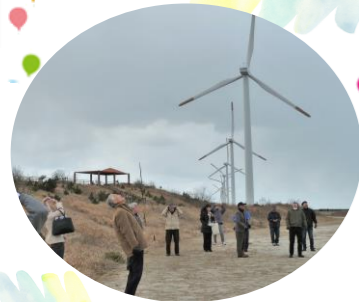
ひびき灘 風力発電