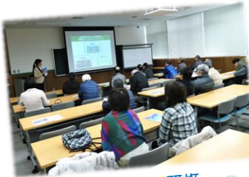
エコタウンでの研修