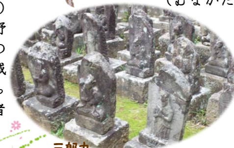
三郎丸 宗像四国東部霊場八十番札所 (赤間～山田)