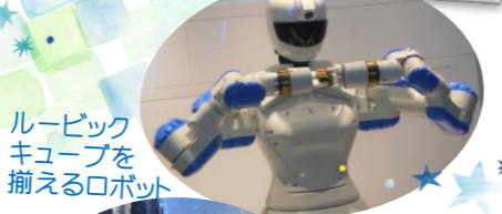
ルービックキューブを揃えるロボット