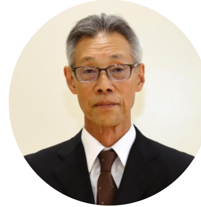
コミュニティ運営協議会