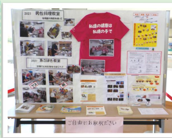
健康福祉部会(食進会) 活動報告 5月11日～31日

新型コロナウイルス感染拡大防止のため、中止になった2月の「かとコミ文化祭」に代わり、4月1日(金)より「作品展示会」を開催しています。9月までの展示の様子を順次掲載します。