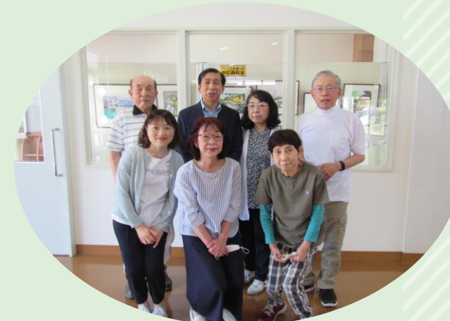
アトリエ自由ヶ丘水彩画クラブ